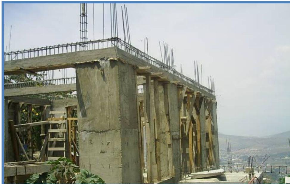
Foto 2 Colado de traves de entepiso de concreto reforzado con aceros.

El colado de las traves de entepiso se realizo hasta media altura para permitir la adecuación de las viguetas prefabricadas en el lugar de la obra.