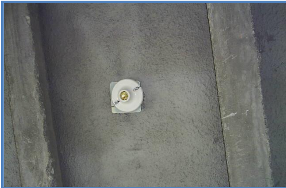
Foto 10 Tiroleado del plafón y vista de la adecuación de la instalación eléctrica.

En esta etapa se aprecia el recubrimiento con mortero del plafón, en esta etapa se cubre totalmente la malla cimbra.