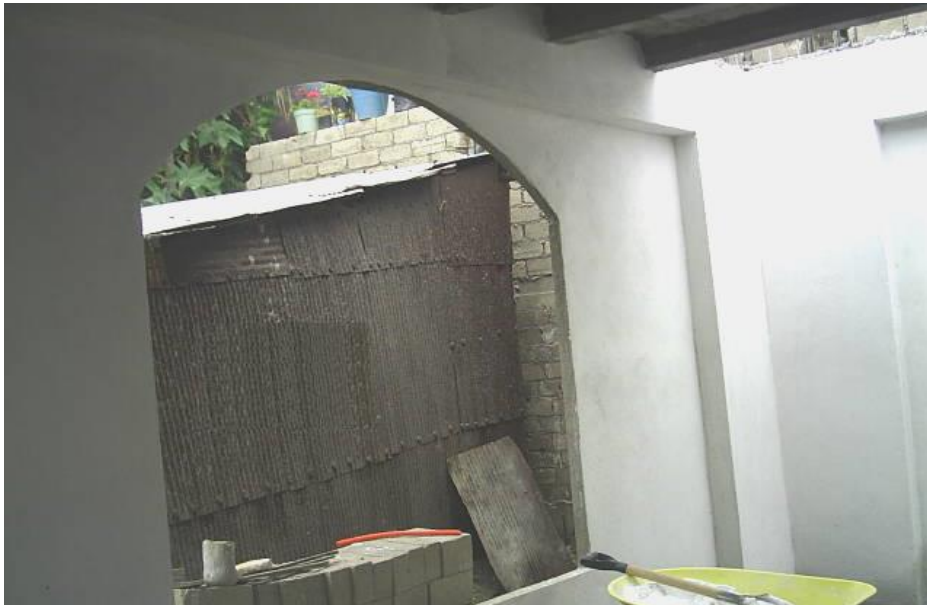
Foto 14 Muro terminado con acabado texturizado con cemento blanco.

Este muro tiene un espesor final de 4.00 centímetros y está listo para recibir a la ventana de herrería.