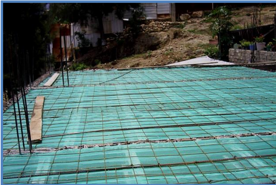
Foto 4 Colocado de las varillas corrugadas, malla electrosoldada y malla cimbra en losa de entrepiso.

En esta etapa de construcción se deberá prever que las varillas principales sean empotradas en las zonas donde se tenga contacto directo con las estructuras de soporte principal y las estructuras de soporte secundario. Este requerimiento es indispensable para proveer de una rigidez que proporcione estabilidad durante y posterior al colado del elemento constructivo.