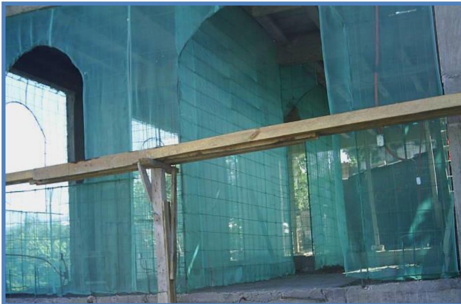
Foto 12 Habilitado total de aceros y mallas para formar las pantallas de los muros.

Después de habilitar los aceros y mallas se realiza la instalación de ductos eléctricos, ductos hidráulicos y ductos sanitarios.