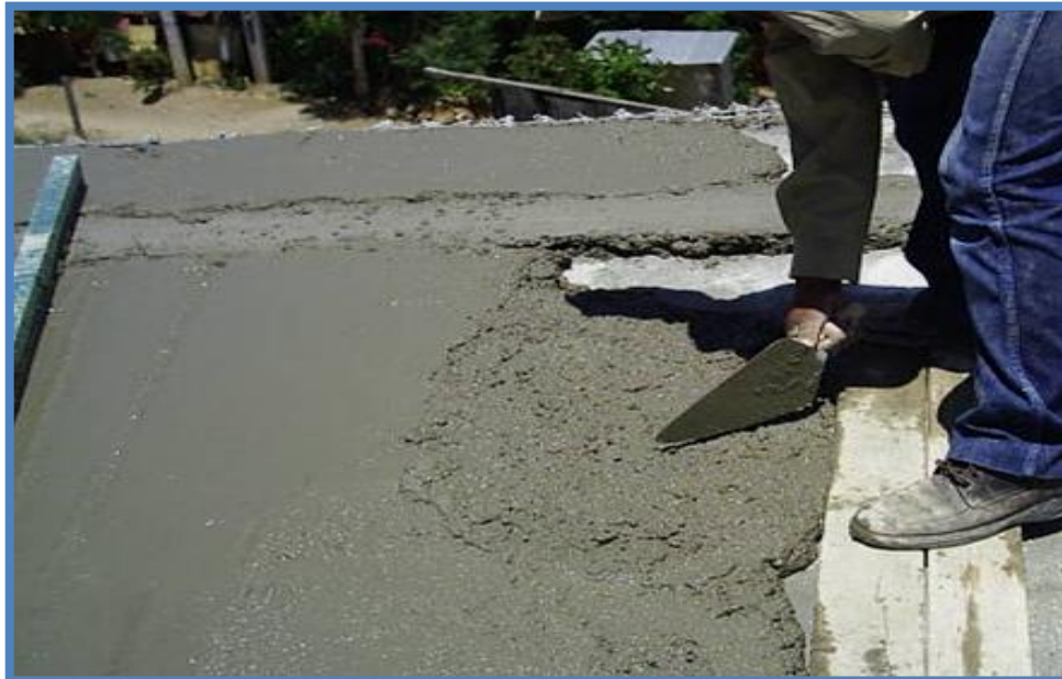
Foto 8 Colado del cuerpo de la losa de entrepiso, segunda etapa o etapa de engrosamiento de losa.

El colado de la losa de entrepiso se realiza por medio de un aplanado superior en forma tradicional. Para el colado de la losa también se puede utilizar gravilla de \frac{1}{4} " para consolidar un concreto hidráulico fino, debe preverse un revenimiento máximo de 8 centímetros de acuerdo a las normas técnicas complementarias para estructuras de concreto.